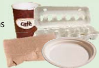
vasos de papel (Sin las tapas), platos de papel, envases de papel de comidas para llevar, envases de huevos de cartón