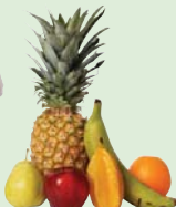
Fruta Sin plásticos, elásticos o etiquetas