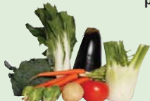
vegetales, mazorcas y cáscaras de maíz, nueces, cáscaras y ensaladas Sin plásticos, elásticos o etiquetas