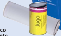
envases de cartón